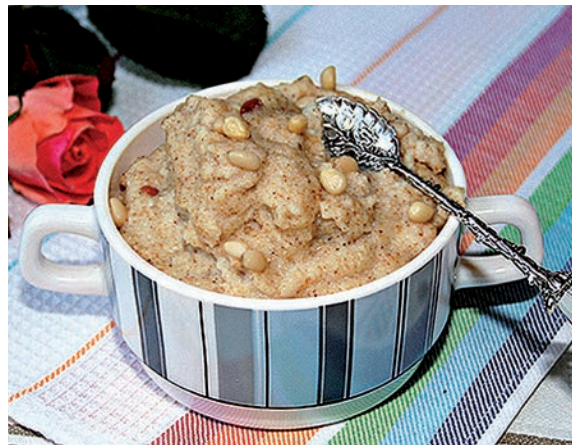
Манная каша с предварительным обжариванием

Все знают, как варить манную кашу. Но наряду с обычным рецептом есть рецепт, где манку перед варкой предварительно обжаривают. Из-за об-