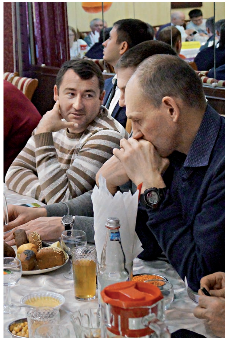
Выращивание нута – дело непростое