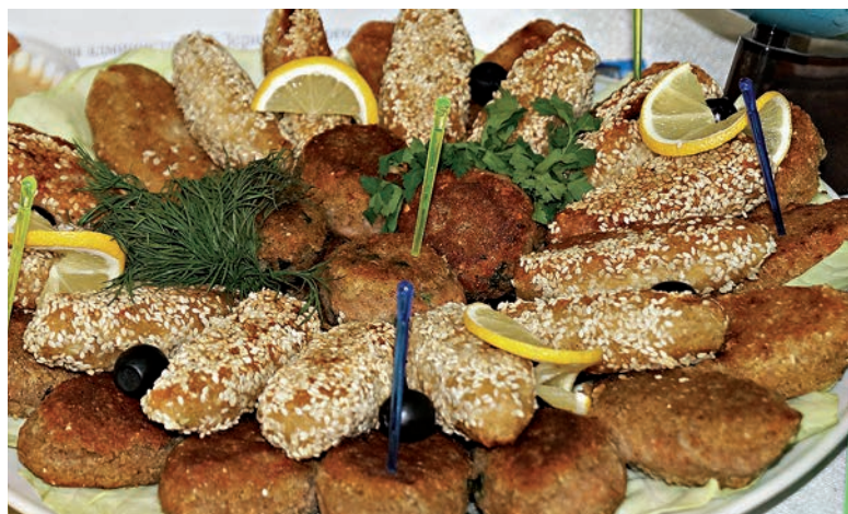
Продукция ПКФ «Маяк» — нут и чечевичные котлеты

Какие проблемы ожидают тех, кто решит выращивать нут? В первую очередь, это отсутствие качественного семенного материала. В «Маяке» его закупают за пределами нашей области. Но я обещаю вам, что скоро будут уже сорта нута и ростовской селекции, мы занимаемся этим. Это, конечно, удешевит их. Для переработки сейчас используют и мелкий, и крупный нут. Но на мировом рынке крупносемян-