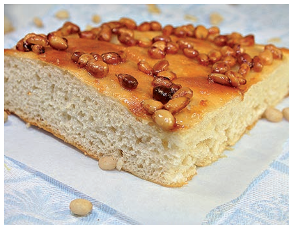
Лепешка с мёдом и орехами

жаривания манка приобретает сильный аромат и розоватый цвет. Крупинки обжаренной манки после отваривания не склеиваются в однородную массу, а ощущаются при еде отдельными крупинками.