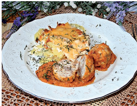
Куриные фрикадельки в чечевичном соусе

На дно формы для выпечки налить немного воды.