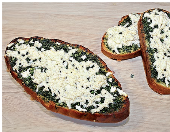
Горячий бутерброд с зеленью и сыром

Выложить фрикадельки. На фрикадельки вылить чечевичный соус.