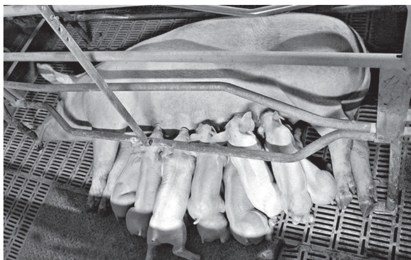
Племенная свиноводческая ферма может окупиться быстрее товарной