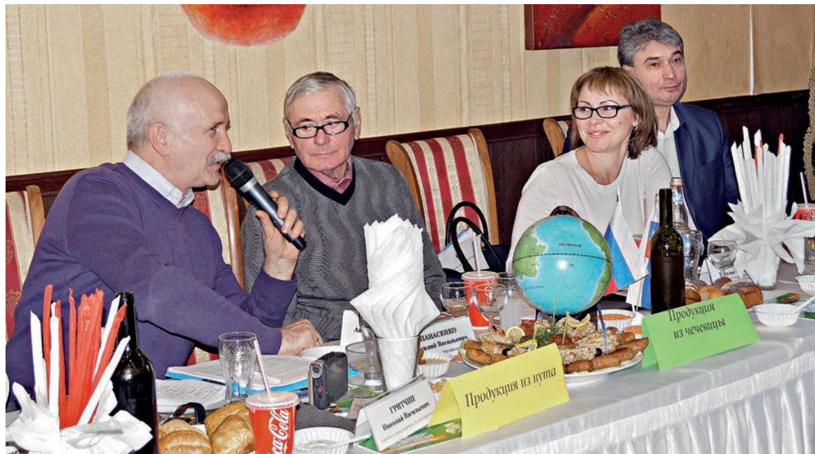
Заседание клуба прошло в домашней обстановке

Об условиях работы в «Донском Маяке» «Крестьянин» писал уже не раз. За то, что аграрии выращивают редкие культуры, кооператив обеспечивает их семенами и удобрениями.