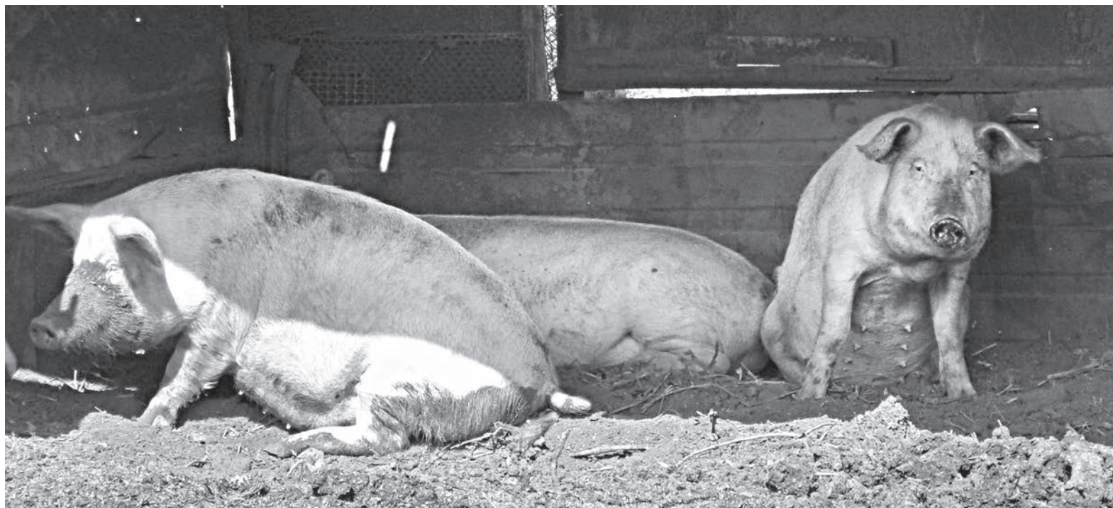
В 2015 году каждая хавронья принесла владельцу подворья до 4500 рублей прибыли. В новом году заработать будет сложнее

2006 год внёс в этот процесс свои коррективы: государство объявило развитие АПК национальным проектом. Фермеры получили льготные кредиты. Многие вложили их в свиноводческие фермы, но прогорели: вирус африканской чумы свиней разрушил планы. Ужа-