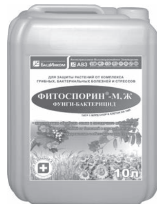
Канистра 10 л