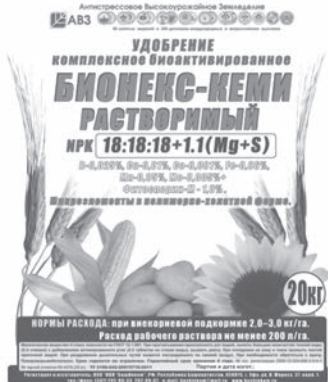
Мешки 20 кг