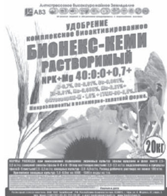
Мешки 20 кг