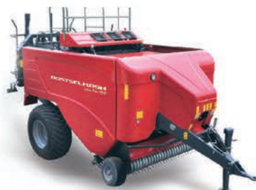
Пресс-подборщик тюковый TUKAN MAX

ширина захвата 1,55 м производительность 10 га/ч