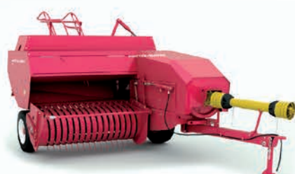
Пресс-подборщик тюковый TUKAN

ширина захвата 1,55 м производительность 10 га/ч