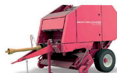
Пресс-подборщик рулонный PELIKAN MAX

ширина захвата 1,45 м производительность до 10 т/ч