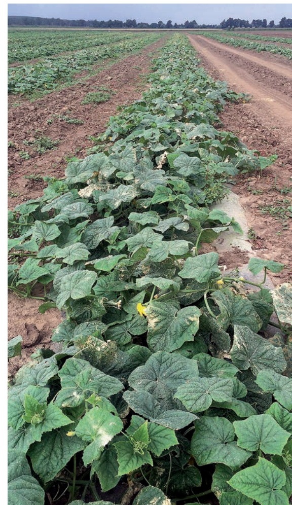
Технология хозяйства + Сигнум (1,25 кг/га)

три. Таким образом фунгицид Орвего оказывает длительное профилактическое и лечебное действие на растение (на ранних стадиях развития заболевания), снижая спороношение оомицетов. Препарат BASF эффективно справляется с этой проблемой, при этом он не обладает перекрёстной резистентностью по отношению к другим классам фунгицидов.