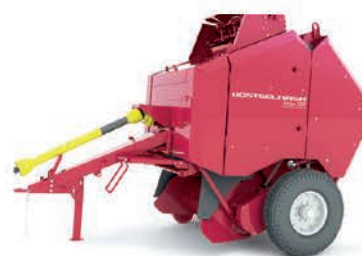
Пресс-подборщик рулонный PELIKAN 1200

ширина захвата до 2,2 м вес тюка сена/соломы до 550/340 кг