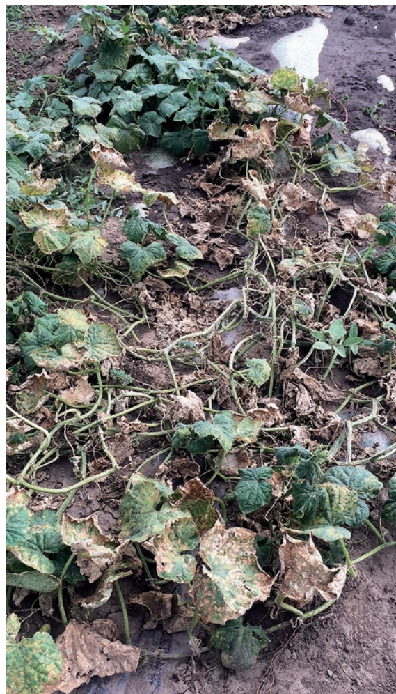
Технология хозяйства (вспышка пероноспороза)

— Препарат Сигнум применили в 2015 году на посевах лука и моркови. Лук обработали однократно, морковь — двукратно. Сигнум применяли в системе комплексных обработок от болезней и вредителей. Фунгицид эффективно сдерживал пероноспороз на луке и мучнистую росу на моркови. Посевы оставались в хорошем состоянии. После уборки урожай хранился без потерь. Фунгицид компании BASF удобен в применении, мы включили его в систему защиты растений. В этом сезоне, как и в любом другом, пестицидные обработки весьма актуальны для овощей. Мы считаем, что применение препаратов для защиты растений экономически оправдано, без них потери урожая могут составлять до 100%.