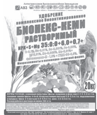
Мешки 20 кг