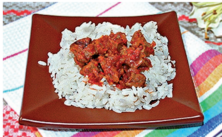
Говядина по-тайски в остром перечном соусе

Пирог очень красивый в разрезе. Тесто сочное, пропитанное мясными соками. Мясная начинка создаёт приятные и несколько неожиданные ощущения при еде, так как для начинки берётся не фарш, а нарубленное маленькими кубиками мясо. Но мне в этом пироге не хватало остроты. Возможно, было бы неплохо вместо свежего сала взять солёное с чесноком. Или подавать пирог