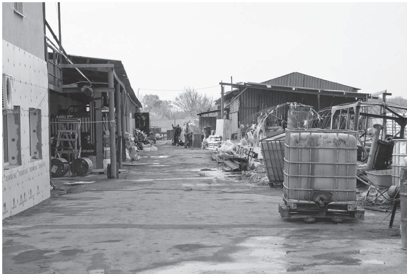
Так выглядит производство