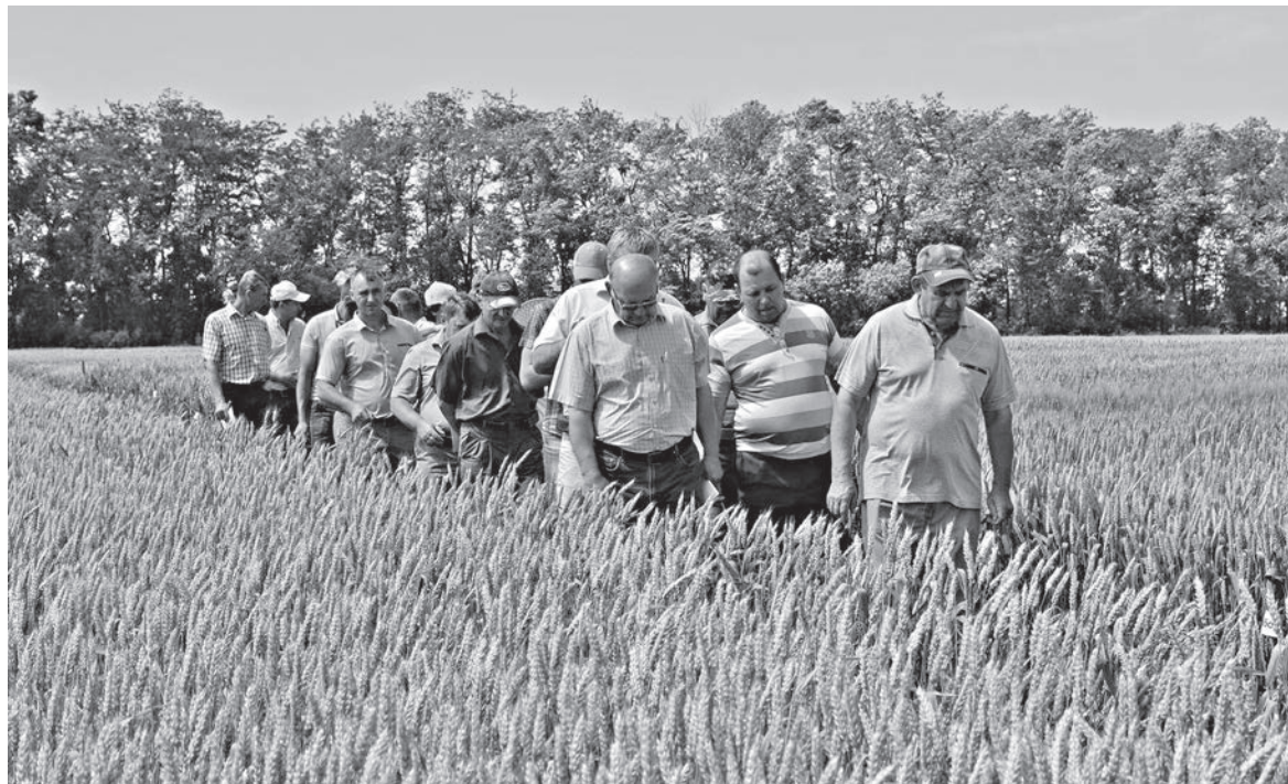
Северо-Кубанская опытная станция приглашала фермеров на демонстрационные поля, делилась информацией, консультировала в вопросах земледелия

У Северо-Кубанской опытной станции отняли треть земли под жилищное строительство