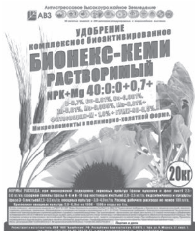
Мешки 20 кг

Бионекс-Кеми Растворимый 35:0:0 НРК+S+Mg = N-35%; S-6%; Mg-0,7%