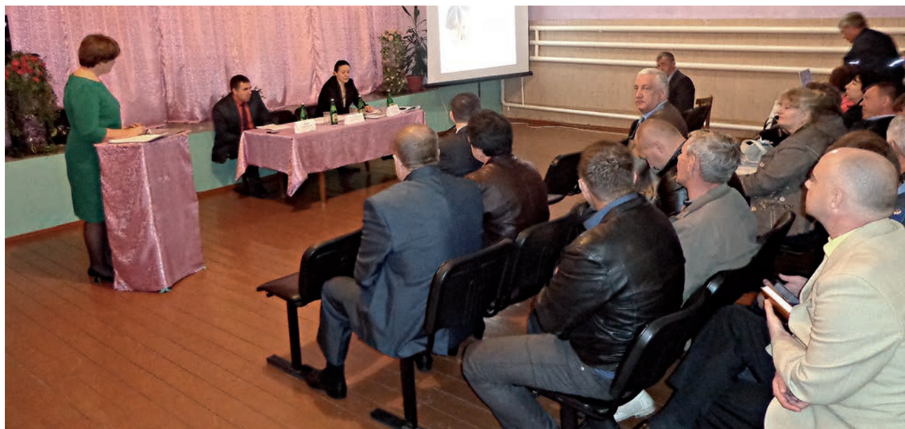
Совещание в сельском клубе хутора Михайловка

— В этом году в Ростовской области в два раза увеличен лимит на предоставление грантов — порядка 411 млн рублей (в 2015 году было 183,2 млн рублей). Поэтому наша задача сегодня — вовлечь как можно больше граждан для участия в грантовых программах. И основное участие в этой работе должны проводить главы муниципалитетов, потому что программы эти