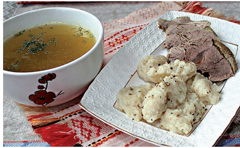
Ароматная отварная говядина с бульоном и клёцками