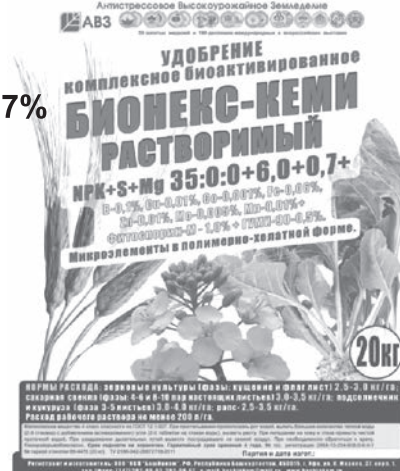
Мешки 20 кг