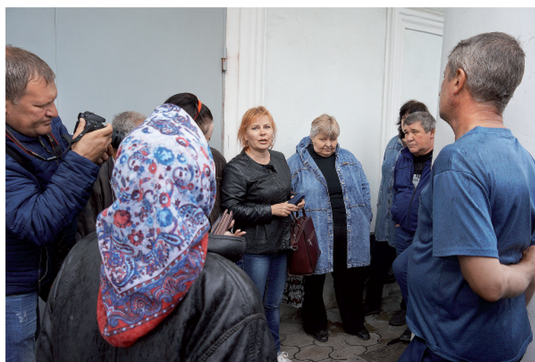
Участники обсудили детали предстоящего похода в Москву

После объявления шахтёрами забастовки губернатор Ростовской области вмешался в ситуацию. Из средств принадлежащего правительству АО «Региональная корпорация развития» (выкупила имущественный комплекс «Кингкоул») организованы выплаты работникам. В порядке очереди. Периодически публикуются списки тех, кто может получить деньги. Но часть людей рискует ничего не дожидаться.