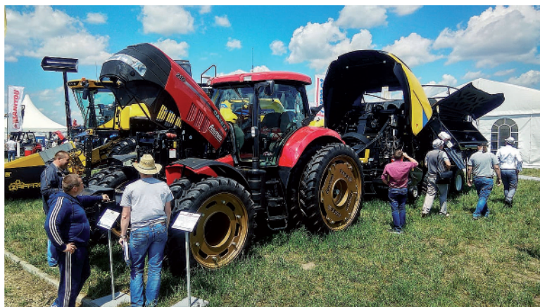
Трактор Case IH Puma 210 и пресс-подборщик New Holland BB 1290

и кормозаготовительная техника KUNN, разбрасыватели и бочки для внесения органики JOSKIN, чизельные плуги и культиваторы BEDNAR и каток-измельчитель Dal-Bo.