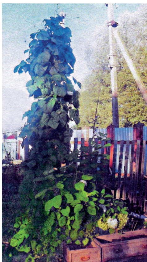
«Кипарис фаселевый», выращенный в Калужской области