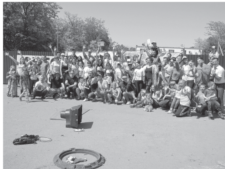
Эти люди освободили рощу от 4 тонн мусора

– Почему именно игры? Почему не просто субботник? – Потому что именно в таком формате можно за короткий промежуток времени созвать