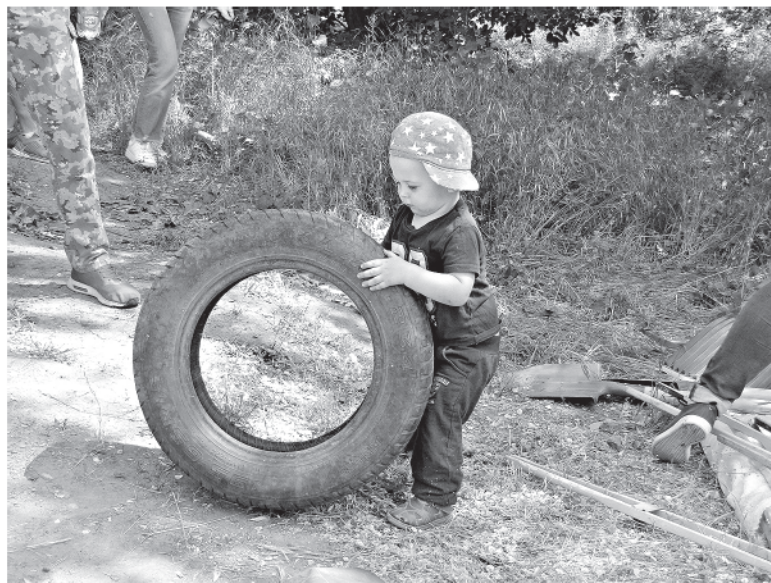
Самый юный участник

Близится финал, и команды собираются на центральной площадке. Есть семейные команды, есть соседские, есть дружеские – в среднем по два-четыре человека. Многие несут с собой «артефакты» – необычные находки, которые они представляют на конкурсе. Чего тут только нет! Богатейший набор обуви, виниловые пластинки, череп динозавра и кости то ли неандертальцев, то ли внеземных пришельцев (по крайней мере,