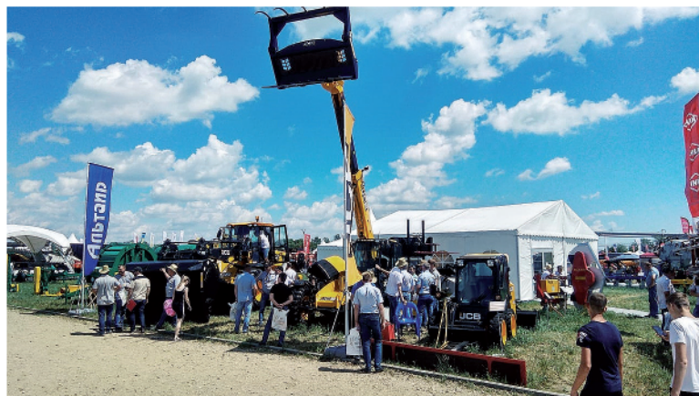
Жёлтые погрузчики JCB всегда в центре внимания!