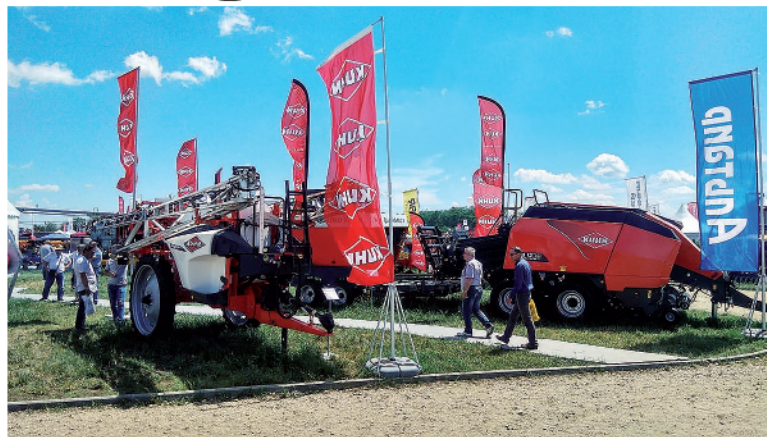
Опрыскиватель Lexis и пресс-подборщик LSB 1270 французского производителя KUNN

Сегодня сельское хозяйство требует технику, которая будет сберегать ресурсы владельца — денежные, технические, трудовые и природные. На «Золотой Ниве» компания «Альтаир» сделала акцент именно на той технике, которая позволит сельхозпроизводителям повысить окупаемость своего производства. Это телескопические погрузчики JCB, почвообрабатывающая