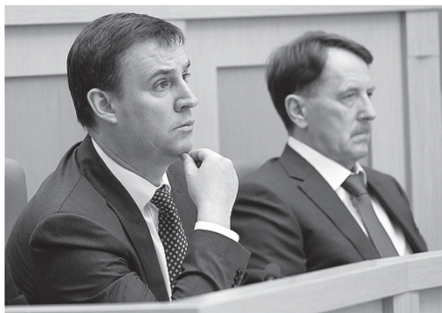
Министр сельского хозяйства верит, что село — место сосредоточения передовых технологий и инвестиций

Она началась ещё до прихода Дмитрия Патрушева на пост министра. В 2017 году с подачи ФНС была принята Хартия в сфере оборота сельхозпродукции, объявлена