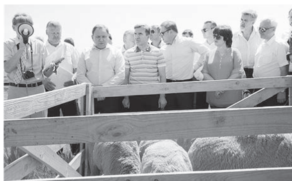
Рабочая группа оценила перспективы развития кластера на месте

ли кластера, на территориях каждого из шести районов юго-востока области будет создан полный базовый цикл производства говядины специализированных пород крупного рогатого скота минимум на 5 000 голов маточного стада. В значительной мере кластер будет опираться на небольшие фермерские и личные подсобные хозяйства, рассчитанные на 180-300 голов с пастбищным содержанием.