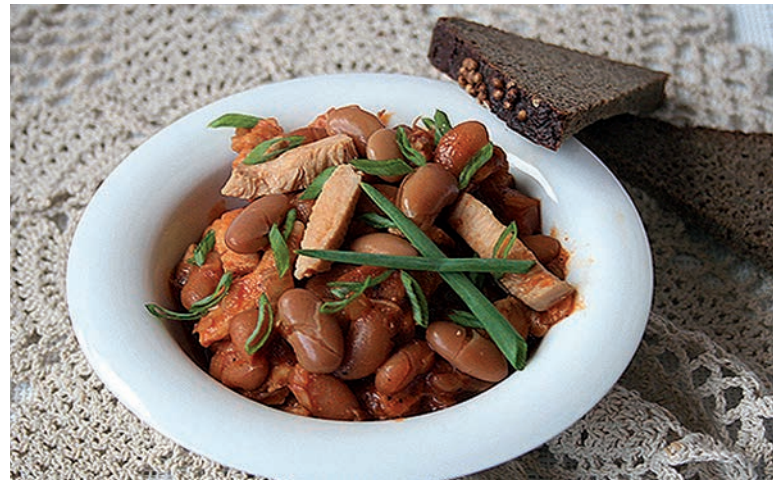
Курица, тушенная с консервированной фасолью