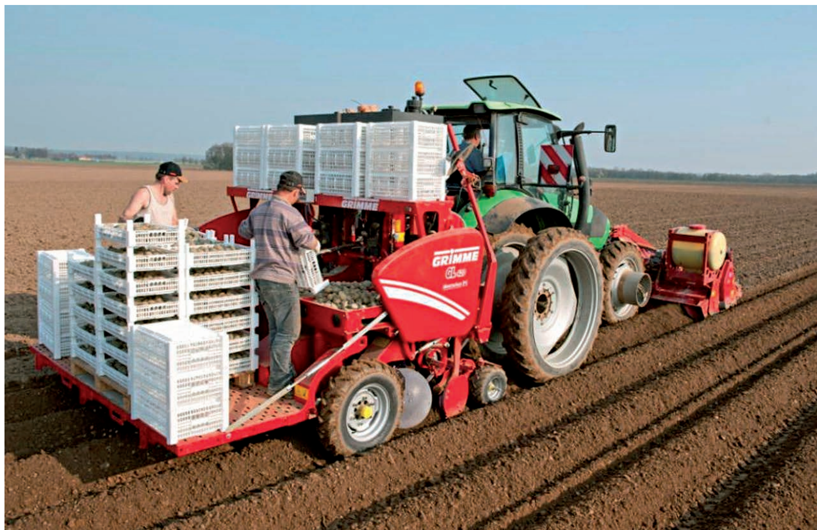
За счёт механизации труда хозяйство может увеличить производительность втрое