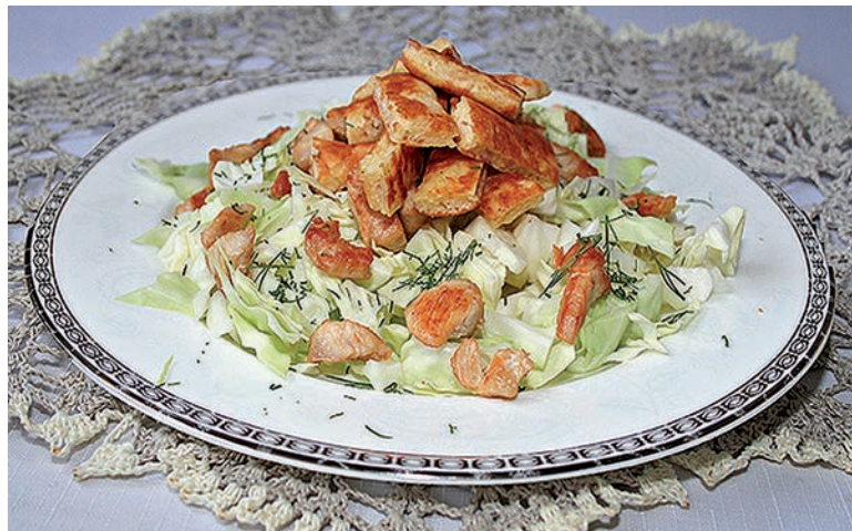
Салат из капусты с курицей и сырными блинчиками

Курица хорошо сочетается с любым видом бобовых. А с консервированной фасолью курица наиболее вкусна. Большим плюсом этого блюда является то, что фасоль берётся уже готовая. Поэтому значительно сокращается время приготовления.