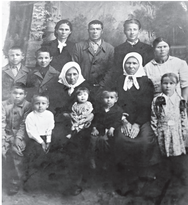
Семья Шатерниковых в 1952 году