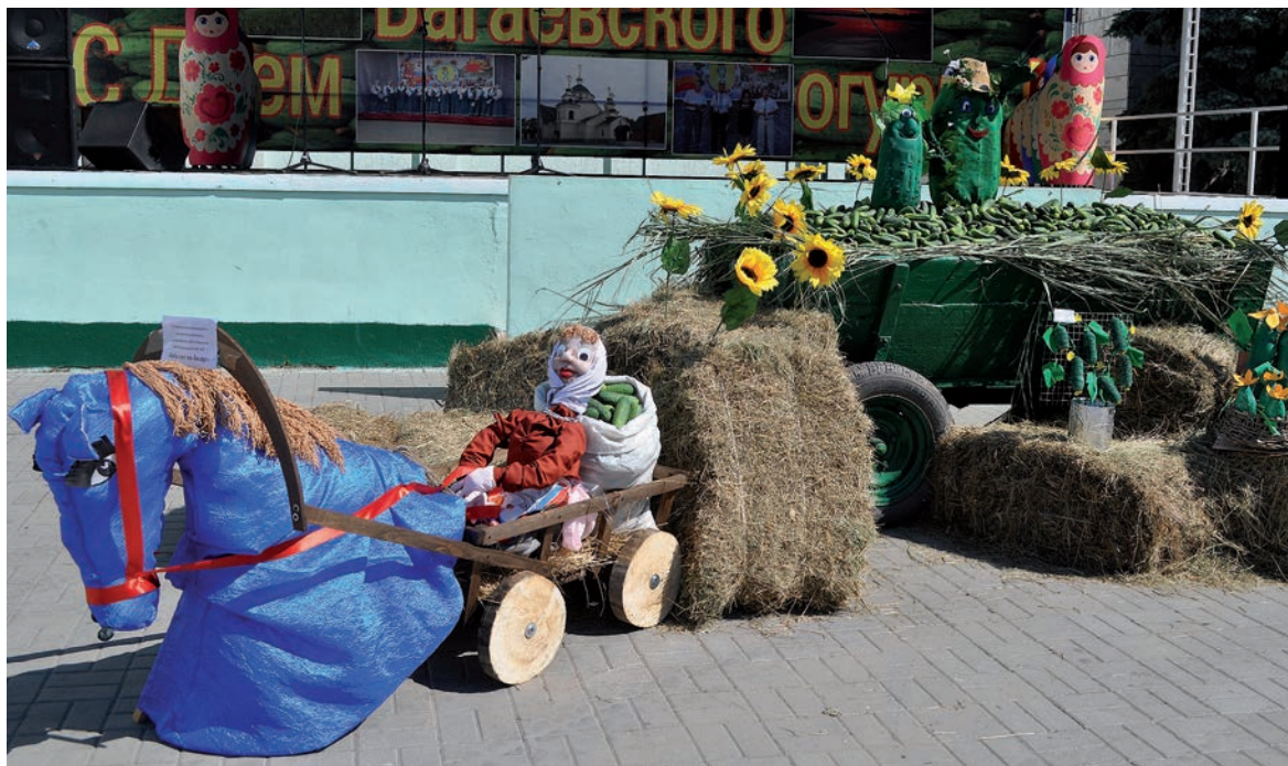
В каком только виде не предстали огурцы на празднике!

Конкурсные работы купить нельзя. Кошельки тут прячут, достают фотоаппараты и телефоны. Главные герои картин, фотографий, стихотворений, инсталляций — именитики огурцы. Точка, точка, огурчик... — они, и правда, по большей части очеловеченные. А неподалёку на площади выстроились шеренгами человечки, ставшие на время овощами. Самая приметная — груп-