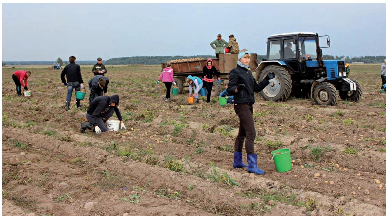
Больше половины хозяйств в стране до сих пор практикуют экстенсивные технологии

— Применение картофелепосадочных машин позволяет сократить количество работников с 30 человек до четырёх, кроме того, машина протравливает клубни перед посадкой, обеспечивая защиту от болезней и насекомых. Одновременно вносятся удобрения для быстрого старта вегетации рас-