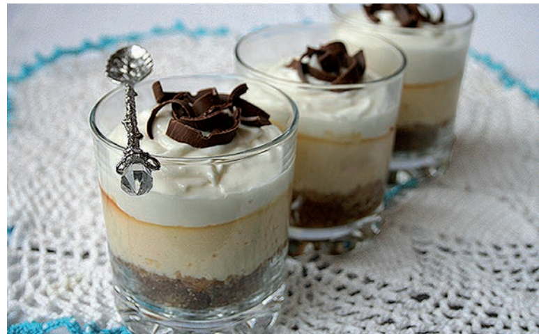
Чизкейк в стакане