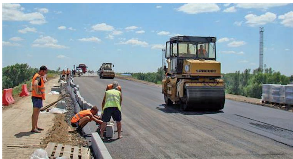
Последние «штрихи» перед пуском