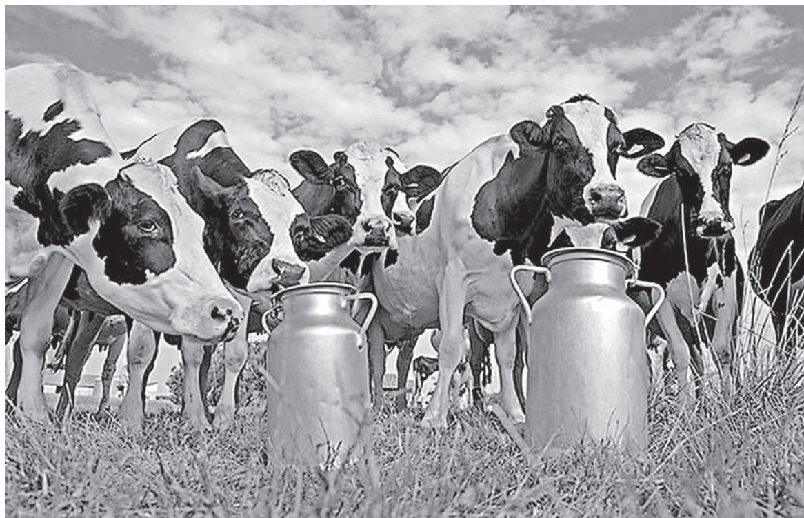
Объёмы производства молока падают

Но триумф донского минсельхозпрода омрачился публикацией отчёта Счётной палаты об оценке эффективности господдержки молочной отрасли. Ростовская область, несмотря на небольшой рост валового надоя молока в текущем году, попала в число регионов с недостаточной эффективностью господдержки.