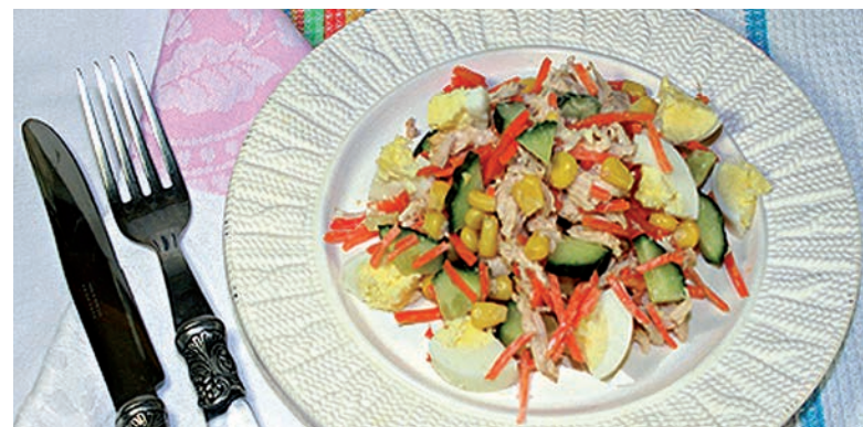
Салат с курицей и морковкой по-корейски