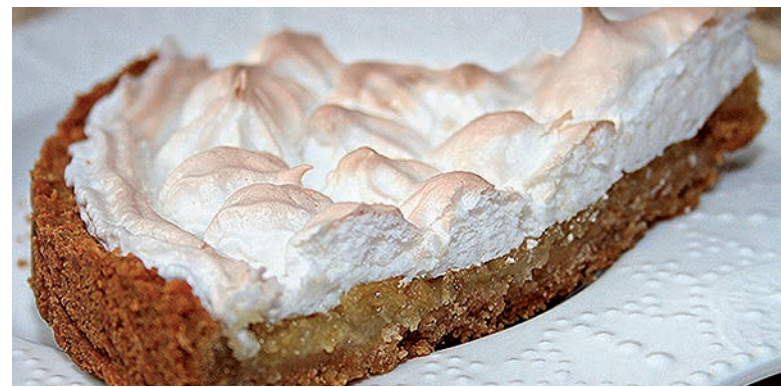
Лимонный пирог с безе на основе из печенья

Белки взбить, постепенно подсыпая сахар тонкой струйкой под вращающиеся лопасти миксера.