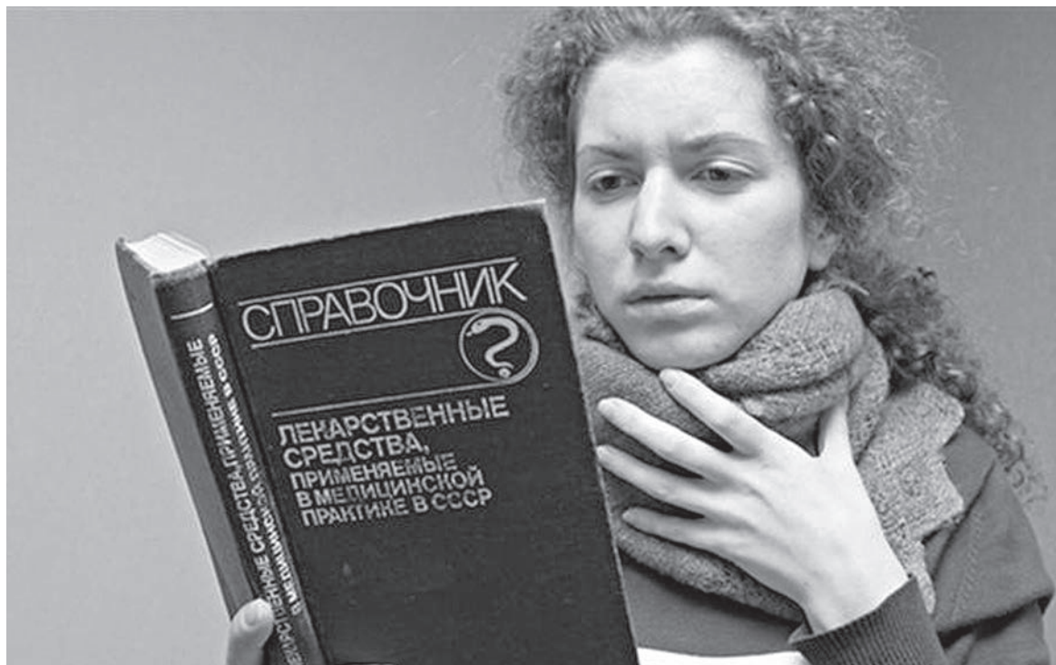
«Вычитать» лекарство в справочнике и купить в аптеке — не лучший способ лечения

Недостатки в медицинском образовании неминуемо приводят к дефектам в диагностике и лечении. На новейшем зарубежном оборудовании медики зачастую не умеют работать. Ещё одна важная причина высокой смертности — отвратительное качество