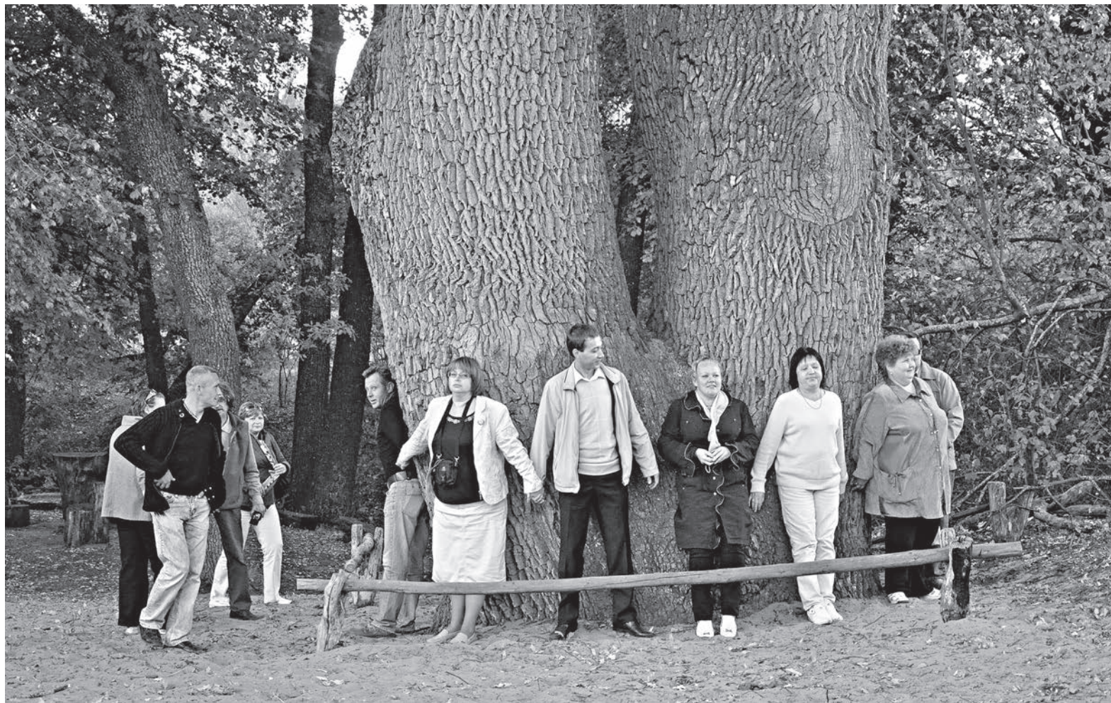
Дуб-великан в окрестностях ст. Вёшенской

Что в Ростовской области с охраной природы всё обстоит, мягко говоря, неблагоприятно, признают специалисты на самых разных уровнях — от