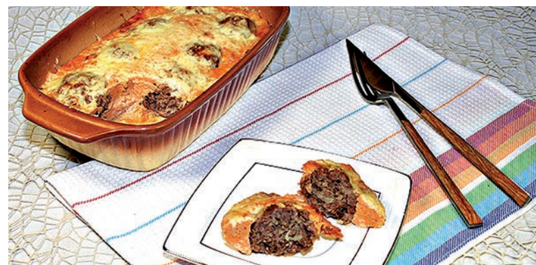
Фрикадельки в омлете