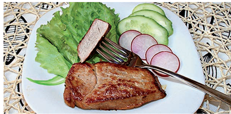
Жареная свинина с медово-горчичной корочкой

Пока запекается начинка, приготовить безе.