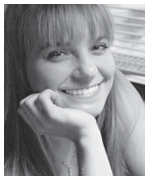
Александра КОРЕНЕВА, специальный корреспондент

Депутаты Госдумы пожаловались на нечеловеческие условия работы. Случилось это после того, как пленарное заседание, на котором обсуждался бюджет 2017 года, задержали до 20:00 вместо положенных 18:00.