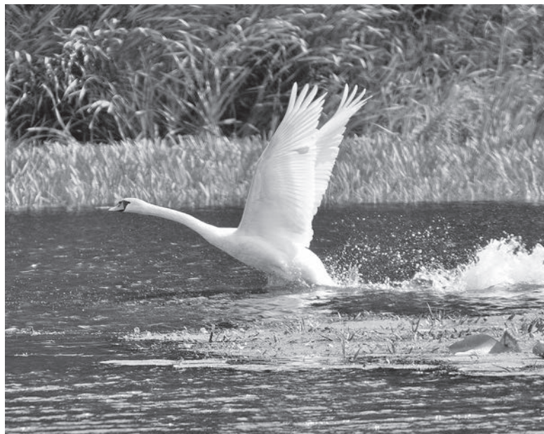
Пойменные озёра в Шолоховском районе