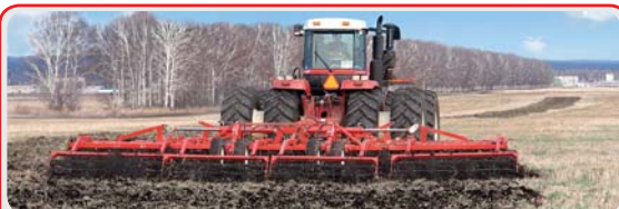
Дисковый агрегат « DISKOMASTER »