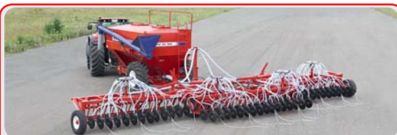
Дисковый посевной комплекс « AGRATOR DISK »