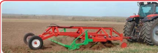
Чизельный плуг « CHIZELMASTER »