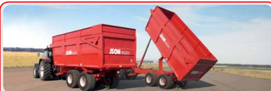
Прицеп самосвальный « ISON 8520.1 »