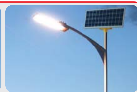
Светодиодные светильники на солнечной батарее