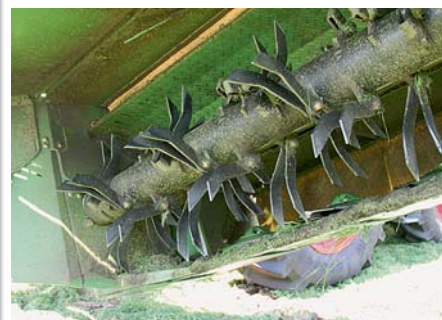
Зубья у плющилки инженеры Krone изменили. При наезде на препятствия они отклоняются назад.

мые щитки для распределения травы по всей ширине захвата. Мы эксплуатировали косилку на лугу во время позднего первого укоса. „Впряженный“ между косилками трактор Fendt Vario 718 мощностью 132 кВт/180 л.с. при таком густом стеблестое и на мягкой болотистой почве при скорости от 14 км/ч достигал своих пределов мощности. Но при почти 5,95 м эффективной рабочей ширины и плющилке, установленной в среднее положение с 900 об/мин, это отвечает норме. Высота среза, по данным Krone, может изменяться посредством верхней тяги от 3 до 9 см. Для работы на высокой стерне дополнительно можно установить ползки для высокого среза. Настройка основных позиций у фронтальной косилки осуществляется автоматически через нижние тяги. На задней косилке рычаг управления служит ориентиром: если косилка расположена горизонтально, то все в порядке.