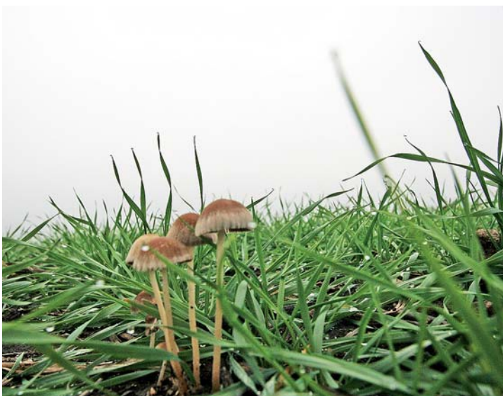
Грибы на каждом шагу

получался явный брак: земля выворачивалась, налипала. Выход подсказали аргентинцы, которые применяют узкие диски. После замены деталей дело пошло на лад. А в 2010 году Мокриковы и вовсе приобрели настоящую ар-