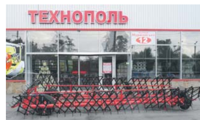
Сцепка с боронами БГ-14