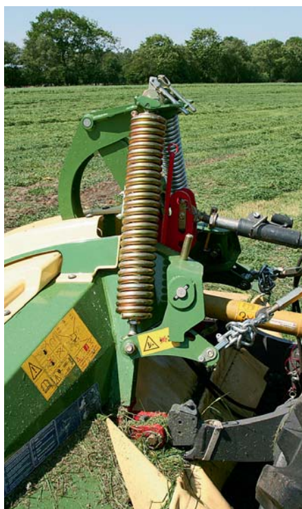
Устройства навески Float изменения коснулись лишь слегка. Здесь опционально устанавливается предварительное гидравлическое натяжение разгрузочных пружин гидравлическим цилиндром, расположенным под обшивкой.

У задненавесной косилки EasyCut R 320 CV в глаза бросается новое навесное устройство и несущая рама. Навесное устройство стало больше и массивнее, в основном из-за того, что Krone сейчас использует крепежные пальцы для нижних тяг задней наве-