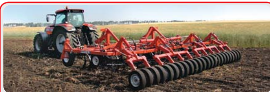
Культиваторы стерневые « LANDMASTER »