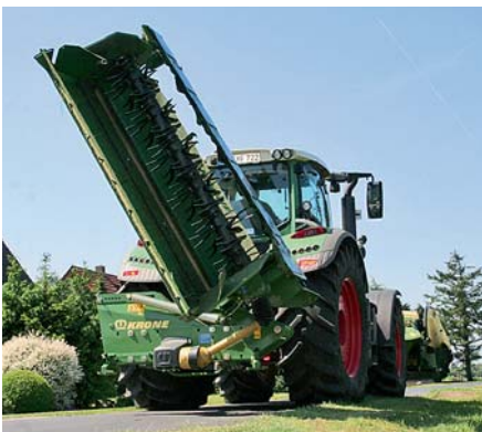
Для движения по дороге косилка складывается назад, гарантируя надежную транспортировку.

разворотной полосе). При гидравлической разгрузке (опция) необходимо еще одно двустороннее устройство управления.