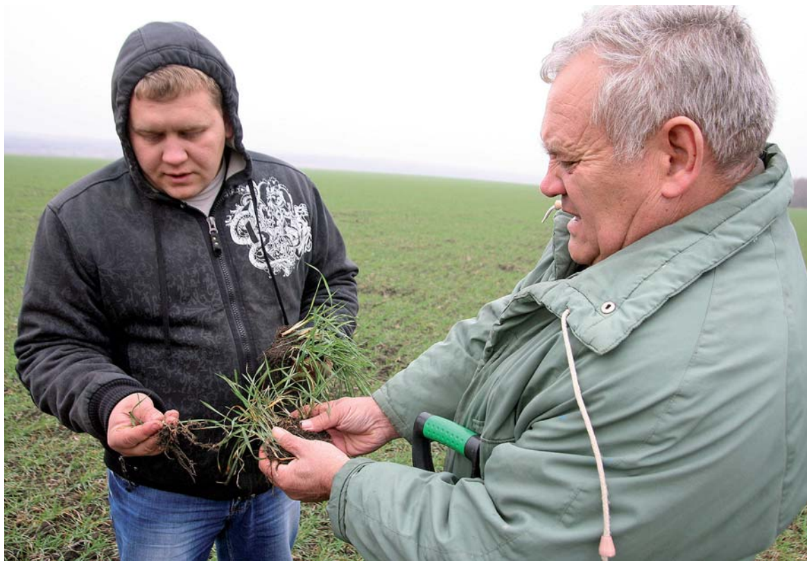
Сын и отец – наука и практика

– Тут надо подчеркнуть, что эту кукурузу мы сеяли по многолетникам – доннику, эспарцету, люцерне, – обращает внимание