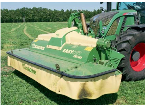
Новый дизайн косилок обеспечивает больше гладкой поверхности и меньше возможностей для скопления травы. Защита от наезда на препятствия выполнена из резины.

ски двух различных категорий. Это – реакция на использование больших тракторов и высоких рабочих скоростей. Навесное устройство привинчено на раме, кроме того, инженеры предусмотрели 3 регулировочных отверстия для настройки ширины двойного среза по отношению к фронтальной косилке, например, под ширину трактора.