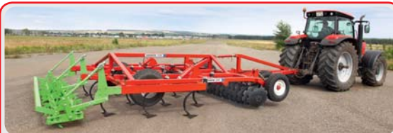
Дисковый глубокорыхлитель « TERRAMASTER »