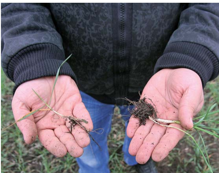
Ростки с соседних полей