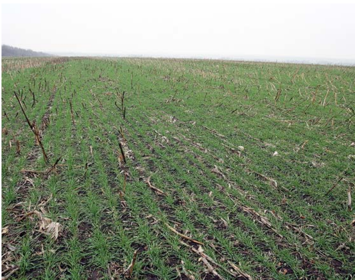
Пожнивные остатки озими помощники

С сеялками прямого посева тоже не сразу получилось. Североамериканские, на которые положили глаз Мокриковы, имели широкие турбодиски. В результате при закладке семян во влажную почву