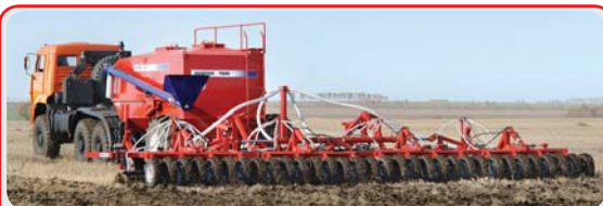
Автомобильные посевные комплексы « AGRATOR Авто »