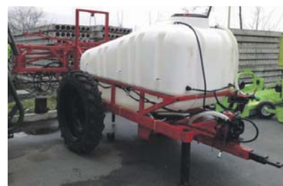
Опрыскиватель ОП 2000