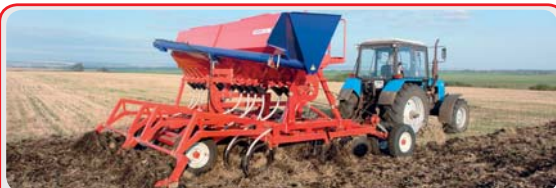
Дискультиваторные посевные комплексы « AGRATOR DK »