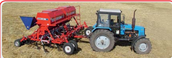
Механические посевные комплексы « AGRATOR M »