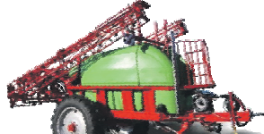
Опрыскиватель «Goliat plus»