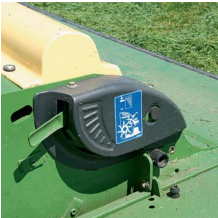
Новые плющилки регулируются семиступенчато. При износе зубьев противорезающую пластину можно дополнительно отрегулировать.