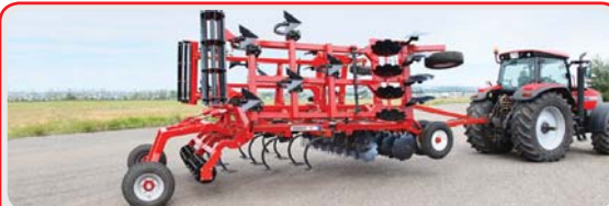
Комбинированный дискультиватор « COMBIMASTER »