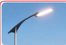
Светодиодные светильники « GELIOMASTER »