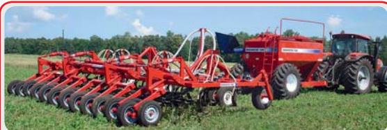
Широкозахватные посевные комплексы « AGRATOR »