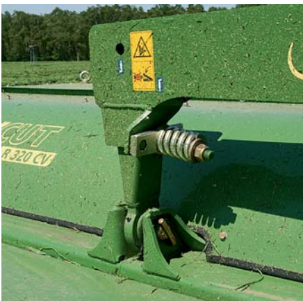
Косилка держится на шаровом шарнире, рукоятка защищает от перегрузки.