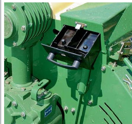
Наконец-то даже у задненавесной косилки появился мобильный ящик для запасных ножей. Редуктор плющилки уже показал себя на деле.

В новой платформе для навески Krone изменила парковочную позицию. Косилка устанавливается на четыре массивных опоры (опция, в серийном оснащении – только одна опора), которые также позволяют установку в транспортное положение и одновременно гарантируют одинаковую высоту точек соединения нижних тяг, что облегчает монтаж и демонтаж. Кроме навесного устройства и верхней тяги, при монтаже косилки необходимо соединить одно устройство управления двустороннего действия (для транспортировки) и одно одностороннего (для разворота на