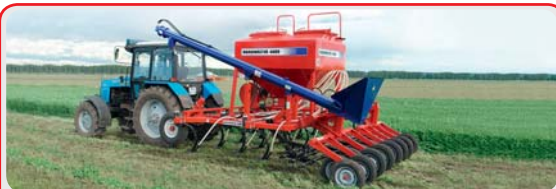
Средние посевные комплексы « AGRATOR »