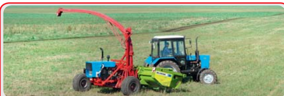
Комбайн кормоуборочный прицепной « МАК - 300 Автоном »