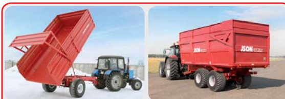
Прицепы самосвальные « ISON »