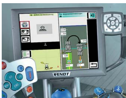
Впервые в тракторах 500 Vario система управления на разворотной полосе включается автоматически благодаря GPS.

Здесь также находится большой терминал Vario с диагональю 10,4 дюймов (опция – у варианта „Profi“ и серия – у „Profi Plus“) и управлением ISO-Bus. Только у варианта „Plus“ предусмотрено дооснащение системой ведения по колее VarioGuide и системой документирования VarioDoc – впервые у четырехцилиндрового трактора Fendt.