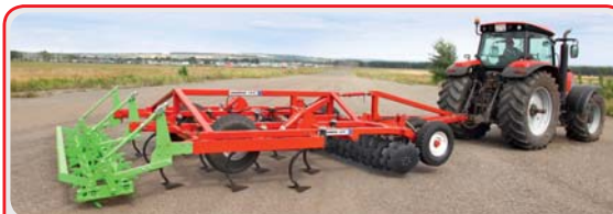
Дисковый глубокорыхлитель « TERRAMASTER »