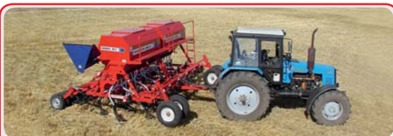
Механические посевные комплексы « AGRATOR M »