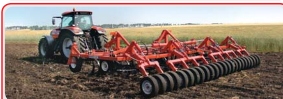
Культиваторы стерневые « LANDMASTER »