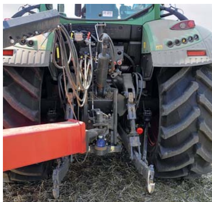
Навесная система нового 500-го поднимает, по данным производителя, почти 7,8 т, новая функция „опускание независимо от нагрузки“ входит в серийное оснащение.

Производительность насоса гидравлической системы составляет 110 л (по желанию – 156 л), и возможно дооборудование 7 клапанами (5 сзади и 2 спереди). Задний подъемник по желанию двухсторонний, а дополнительно к кондиционеру опционально может поставляться автоматическое регулирование температуры в кабине.