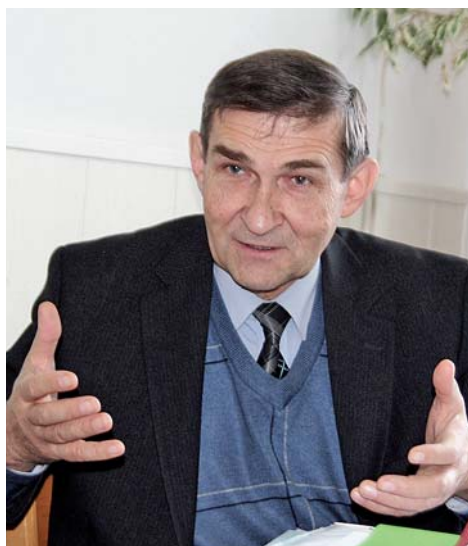
Николай Зеленский предлагает учиться у дикой природы

Ноутил и бинарные посевы — это как раз и есть возвращение к естественным природным процессам — вспашки червями и корнями растений, удобрения отмирающими растительными остатками, сохранения влаги под слоем мульчи и листовым покровом. Когда вы твёрдо настроились заниматься би-