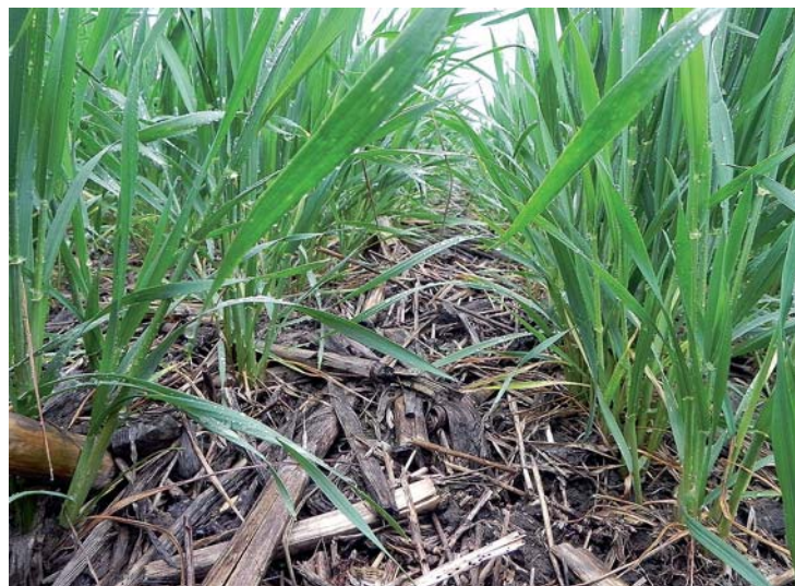
Технология ноутил – важная составляющая бинарных посевов