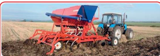
Дискокультиваторные посевные комплексы « AGRATOR DK »