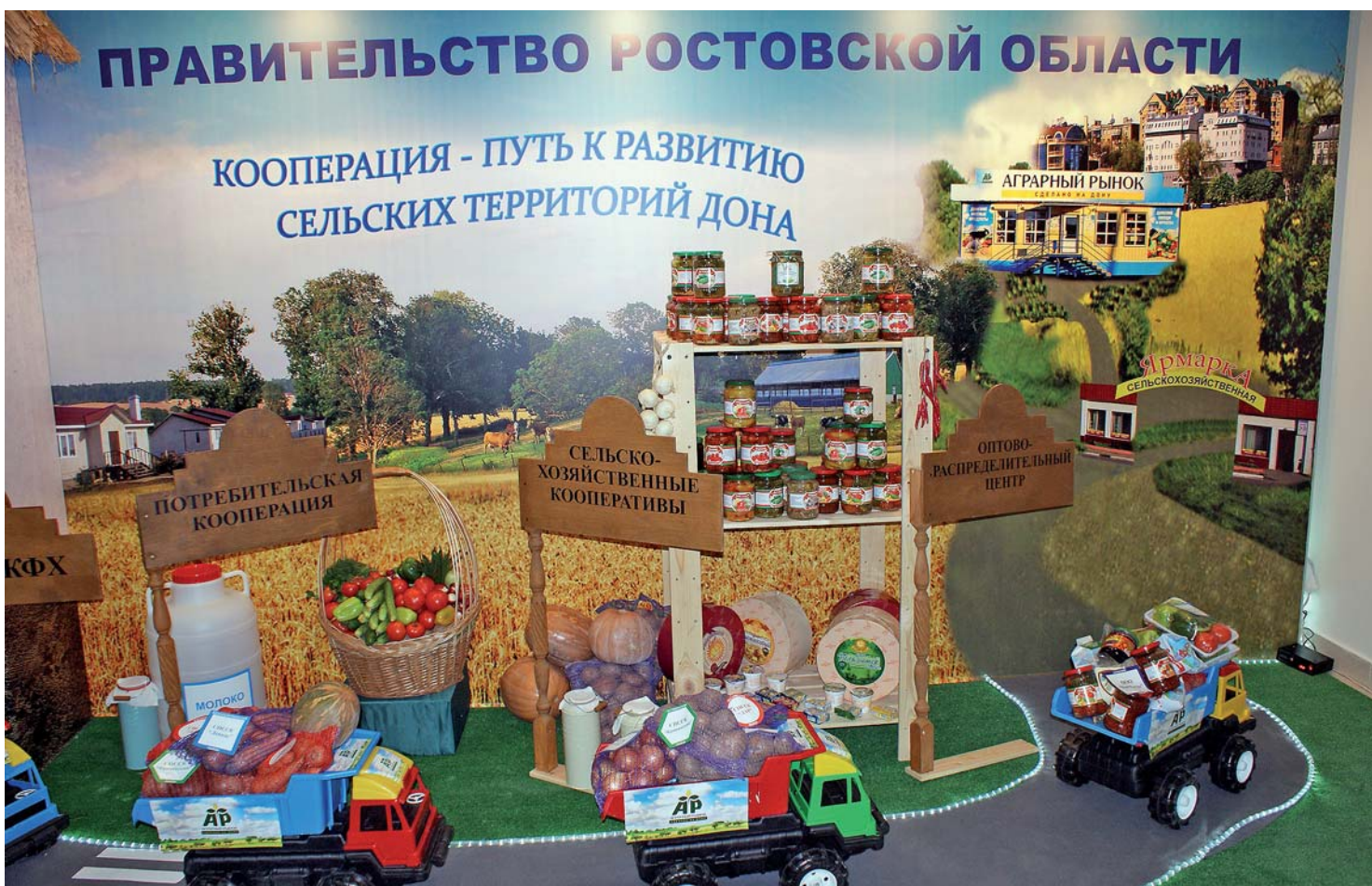
В фойе съезда демонстрировали кооперативное разнообразие Дона