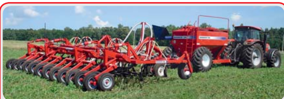
Широкозахватные посевные комплексы « AGRATOR »