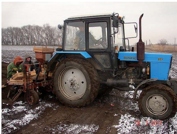
Посадка клубней по снегу

И всё же отличие октябрьской картошки от июньской есть, и оно существенное. Если ранний урожай обычно раскалён до +30 гра-