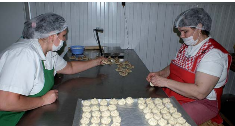
Натуральные продукты из натурального сырья

Каменский р-н, Ростовская область