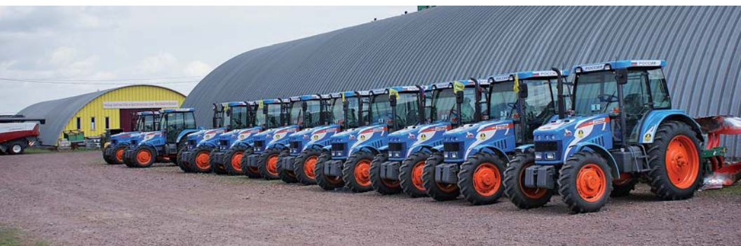
Концерн «Тракторные заводы» предоставил пахарям свою новую продукцию