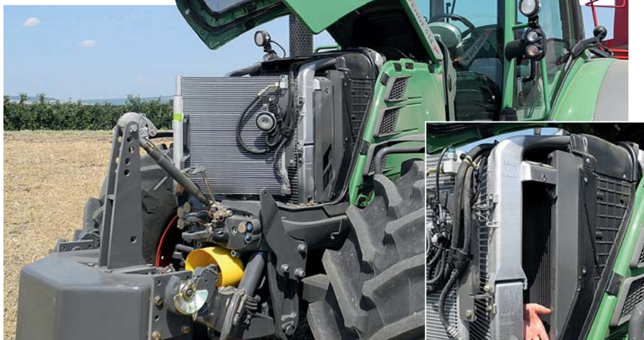
К вытянутой вверх крыше нужно привыкнуть. Катализатор SCR, необходимый для нейтрализации O 3 , находится с левой стороны, через радиаторы рука проходит насквозь, поэтому их чистка упрощена.

Грузоподъемность задней навесной системы составляет 7 780 даН – на 1,2 т больше, чем у 400-й. Также здесь имеется функция опускания независимо от нагрузки, но фронтальный подъемник (опция) в варианте оснащения „Power“ не имеет функции управления разгрузкой. В версии „Profi“/„Profi Plus“ машины оборудованы не только хромированными кольцами фар на переднем капоте и дополнительными местами для хра-