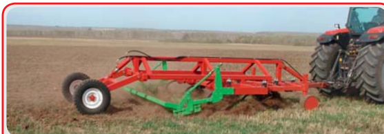
Чизельный плуг « CHIZELMASTER »