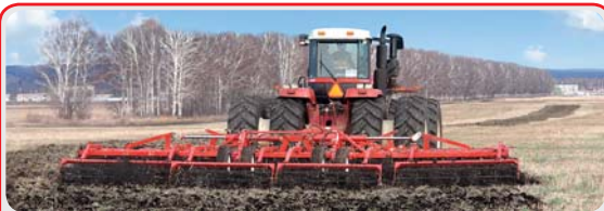
Дисковый агрегат « DISKOMASTER »