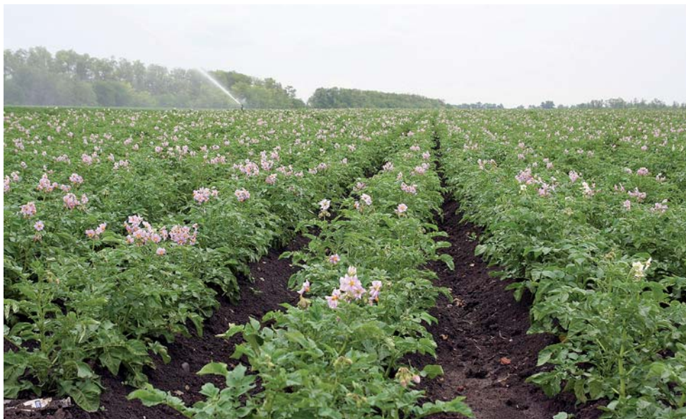
Картошка здесь цветёт уже в середине мая

– Объединённые усилия особенно важны во время уборки раннего урожая, – считает картофелевод. – Дни уже довольно жаркие. Поэтому сбор урожая ведём лишь в утренние часы, максимум до полудня. Позже нежелательно и для людей, и для картофеля, кото-