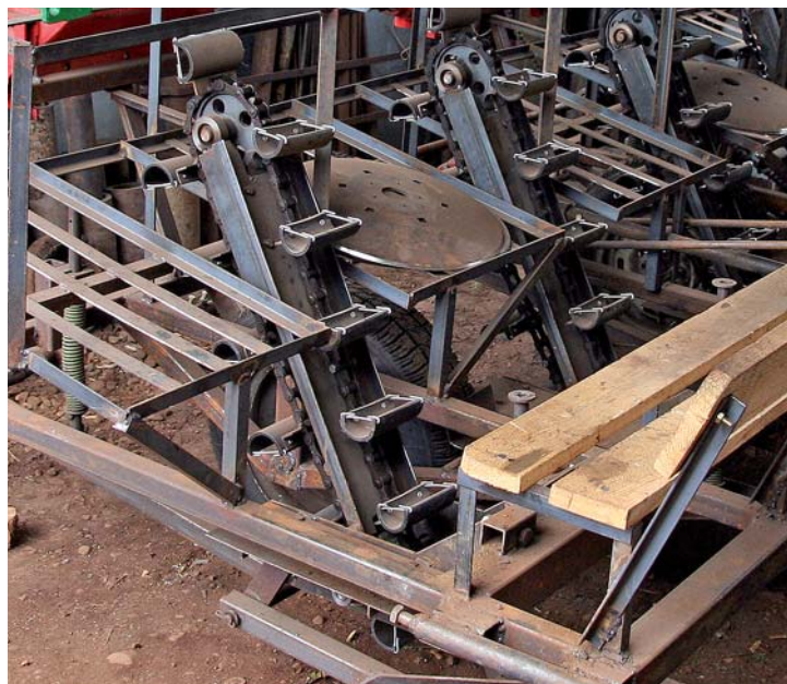
Валерий Вовк обеспечил техническую поддержку землякам