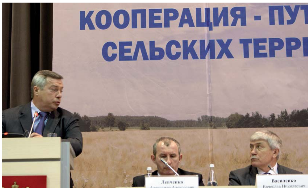
Василий Голубев пообещал придать движению динамику

— Сегодня ни минэко, ни минсельхоз не знают точно, сколько нас, — сказал председатель кооператива Цимлянского района и аргументировал: — Сегодня нам раздали перечень кооперативов. Это данные трёхлетней, даже пятилетней давности. Они стоят на сайте минэкономки. Они неверные. Несколько лет не собирается статистика.