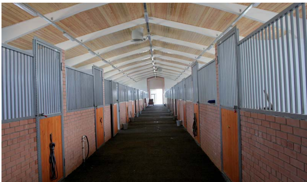
В лошадином общежитии полный порядок

мер с лучшим на сегодня жеребцом в мире по кличке Галилео, который находится на одном из известных заводов в Ирландии. Страховая оценка Галилео фантастическая: 150 млн евро. Случка с ним стоит 300 тыс. евро. Разумеется, жеребец застрахован. Причём страховая компания наняла 18 ветеринаров с мировым именем для оказания экстренной помощи Галилео, если таковая потребуется. Условия найма на работу содержали жёсткое требование: каждый ветеринар должен был проживать в близкой доступности к аэропорту, с тем чтобы через два часа после звонка уже быть в воздухе и лететь спасать жеребца.