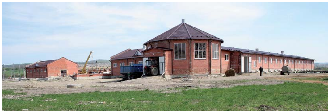
Конезавод наполовину построен

Что касается кобыл и жеребцов скакового отделения, откомандированного на полгода в Краснодар, то их стол куда слаще. Выданные «командировочные» позволяют им разнообразить сено и кашу мюсли и даже ежедневной дозой натурального мёда в 40 г.