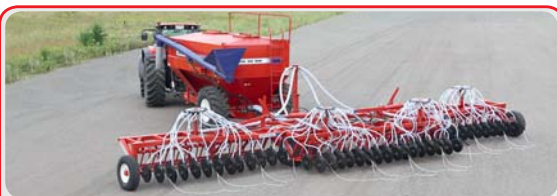
Дисковый посевной комплекс « AGRATOR DISK »