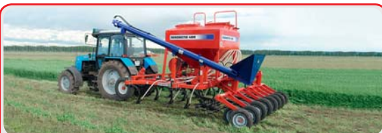
Средние посевные комплексы « AGRATOR »