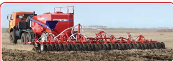
Автомобильные посевные комплексы « AGRATOR Авто »