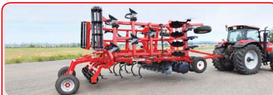
Комбинированный дискокультиватор « COMBIMASTER »