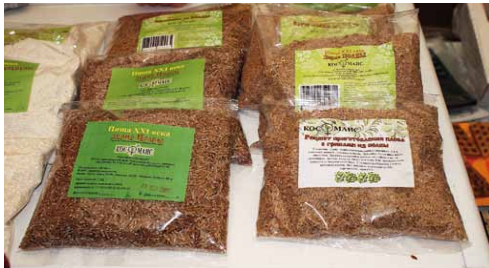
Прародительница пшеницы снова в моде