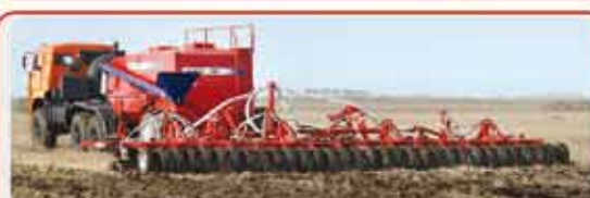
Автомобильные посевные комплексы « AGRATOR Авто »