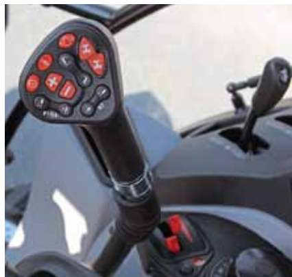
Момент включения автоматического переключения под нагрузкой устанавливается на новом тракторе Steyr Multi правым переключателем разделённого рычага ручного газа. Какие ступени должны включаться, тоже настраивается и указывается на панели приборов.

вания травы на откосах с консолью большой ширины захвата была к тому же разработана фронтальная пластина жёсткости и усилено соединение нижней балки рамы. Таким образом, в зависимости от модели может поглощаться момент кручения до 52 кН/м.