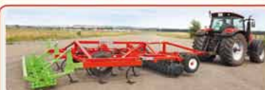
Дисковый глубокорыхлитель « TERRAMASTER »