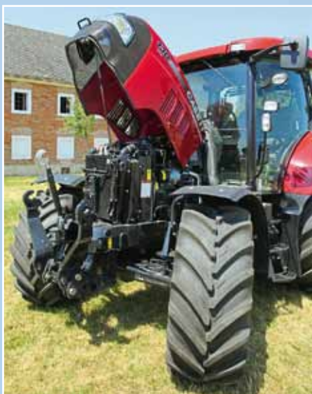
Четырёхцилиндровый двигатель FPT 4,5 л в модели 130 CVX (с Boost от 15 км/ч или при работе BOMa) развивает мощность до 163 л. с. Благодаря катализатору SCR отвечает нормам «Евро IIIb» (Tier 4i).