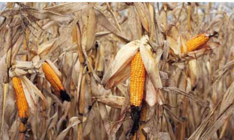
Эти початки вызрели

– Появились ещё более ранние гибриды, и я хочу их использовать, – аргументирует он. – А морозы в сентябре у нас – явление редкое, вряд ли ударят второй раз подряд. Но если даже и ударят, то подкормка органикой в виде сидератов моим полям будет на пользу.