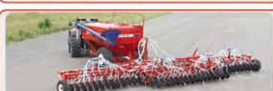
Дисковый посевной комплекс « AGRATOR DISK »