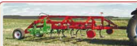
Чизельный плуг « CHIZELMASTER »