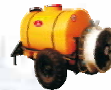
ОПВ-2000 опрыскиватель вентиляторный для опрыскив. садов

Производство сельскохозяйственной техники