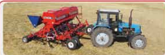
Механические посевные комплексы « AGRATOR M »