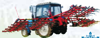
БЛП-9 борона пружинная 9 м.