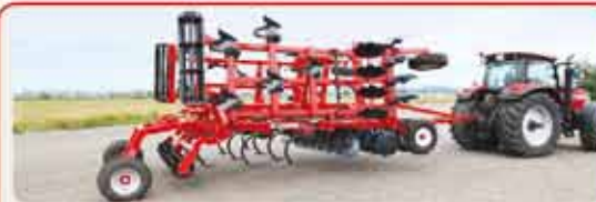
Комбинированный дискокультиватор « COMBIMASTER »