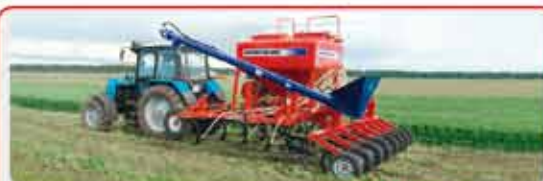
Пневматические посевные комплексы « AGRATOR »