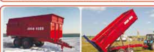
Прицеп « ISON - 8520 »