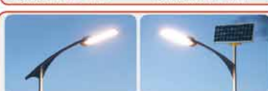
Светодиодные светильники « GELIOMASTER »