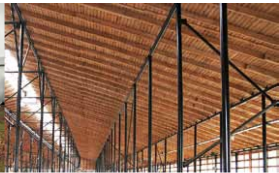
Дощатый потолок — это тепло и сухо