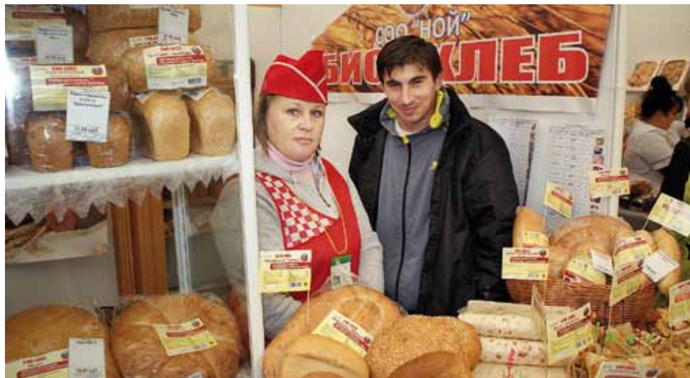
Пекари удивляли разнообразием