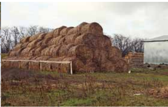
Солому хранят в рулонах