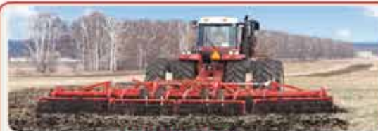
Дисковый агрегат « DISKOMASTER »