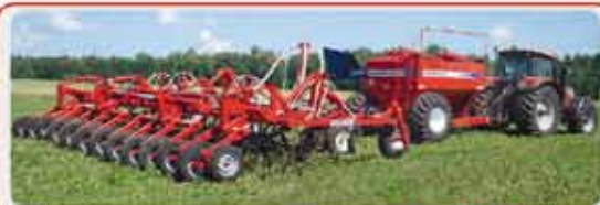
Широкозахватные посевные комплексы « AGRATOR »