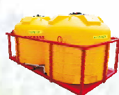
Кассета двухемкостная в раме (2 емкости по 4500л.)