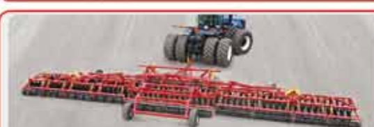
Широкозахватный дисковый агрегат « MEGADISK »