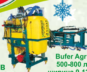
Bufer Agri 500-800 л ширина 9-12 м