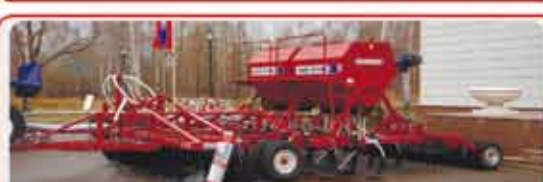
Дискокультиваторные посевные комплексы « AGRATOR DK »