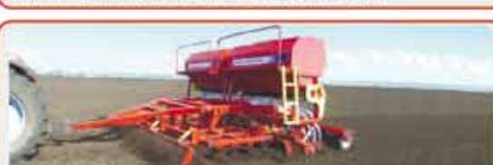
Комбинированный посевной агрегат « COMBIDISK »