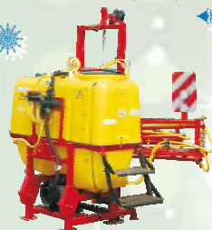
ОН -12 (800)