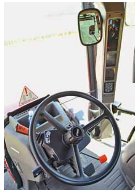
С рычагом реверсивного переключения даже электрический стояночный тормоз (вместе с тормозной системой прицепа!) управляется. Вместо приборной доски есть, как и прежде, индикаторы в правой передней стойке.

ства (например, при оборудовании фронтальным погрузчиком) поставляется до трёх электронных межосевых устройств управления. Они имеют запорные клапаны, не допускающие утечку масла, и могут удобно переключаться маленьким крестовым рычагом в подлокотнике.