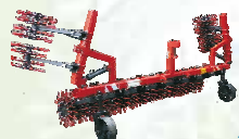
БРК-5,6 борона кольчатая 5,6 м.