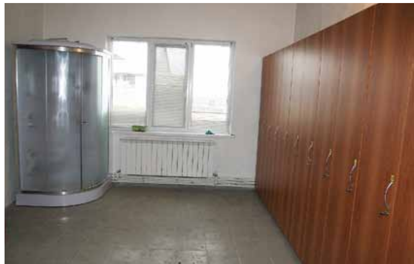
Для персонала – индивидуальные шкафчики и душевая