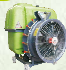
Bufer Agri 600 л