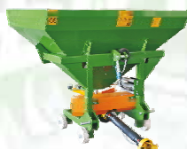
AMAZON-MINI-600 грузоподъемность 600кг.