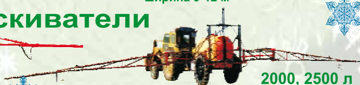
2000, 2500 л ОП-18

Гидравлическая /механическая штанга 18 м.