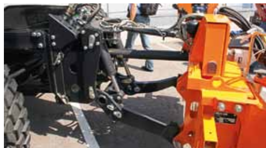
Регулировочные планки позволяют выполнять простую продольную регулировку новой коммунальной рамы (здесь как комбинация фронтального подъёмника). Она предлагается не только для модели Multi, ею могут дооборудоваться все коммунальные тракторы фирмы Steyr, начиная с модели Компракт 4085 и заканчивая моделью CVT 6230.