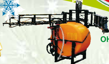
ОН -12 (15м)