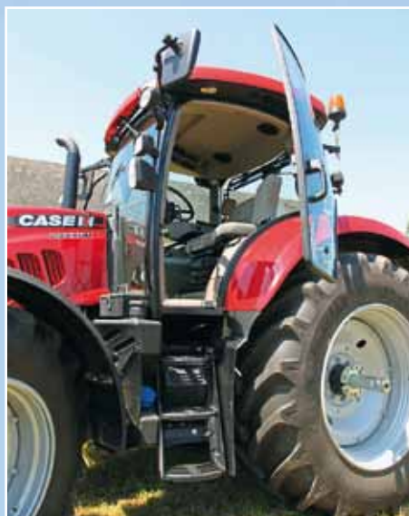
Дизельный бак объёмом до 175 л не очень большой, но баку объёмом 37 л для AdBlue тоже необходимо место. Четырёхстоечная кабина имеет очень широкий подъём и была переработана детально.