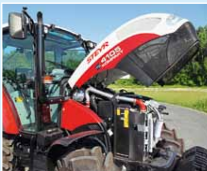
Благодаря возврату ОГ, дизельному каталитическому нейтрализатору и сажевому фильтру четырёхцилиндровый двигатель FPT с рабочим объёмом 3,4 л отвечает нормам «Евро 3b» (Tier 4 i).

предлагается двукратное переключение под нагрузкой вместе с реверсивным переключением и дополнительным приводом управления сцеплением нажатием кнопки (PowerClutch), а также опцией замедленной передачи.