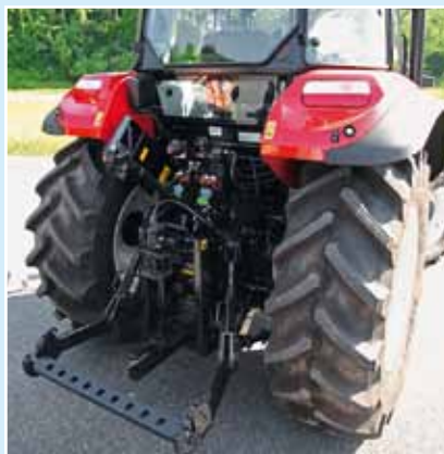
Грузоподъёмность заднего подъемника была увеличена до 3,5 тонн посредством дополнительного подъемного цилиндра.

По желанию кроме полного привода с электрогидравлической блокировкой дифференциала также есть тормоз переднего колеса. Таким образом, шесть тонн общего веса (при 3,7 т собственного веса) можно всегда держать под контролем.