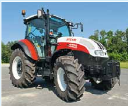
Новый трактор Steyr „Kompakt ecotech“, по данным производителя, не превышает высоты 2,60 м даже с 30-дюймовыми шинами, и рабочие фары встроены в крышу.

Фирма Steyr в рамках своей выставки представила также новый компактный трактор: с уже знакомым по модели Multi турбо двигателем объёмом 3,4 л с системой CommonRail и мощностью 85, 95 или 105 л. с. В основном оснащении коробка передач имеет 12/12 передач. На выбор