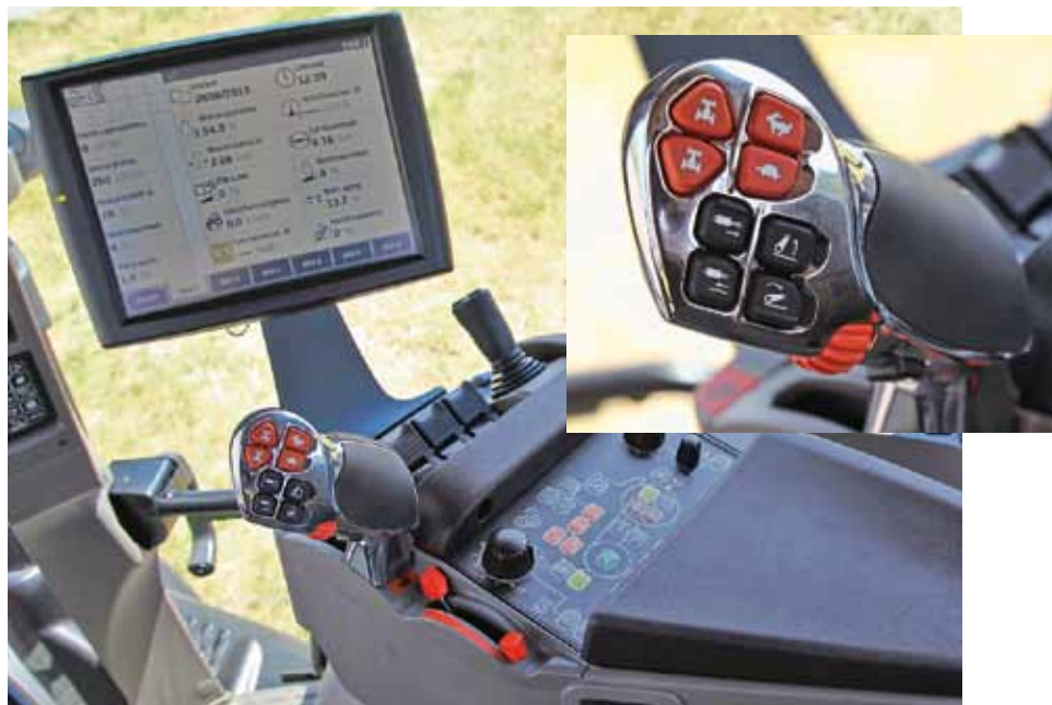
Большой сенсорный экран AFS 700 и электрические гидравлические клапаны есть в оснащении Profi. Кнопки в мультифункциональном рычаге (меленький снимок) теперь подсвечиваются и существенно лучше различимы. С разделённым рычагом ручного газа настраиваются желаемый диапазон частоты вращения и снижение оборотов двигателя для автоматического управления производительностью APM.

Новшеством в гидравлической системе является большой аксиально-поршневой насос, регулирующий давление и электроэнергию, производительностью 125 л/мин. (вместо 113 л/мин.). Кроме того, существует новая система управления трактором Closed-Center и более производительный гидравлический масляный радиатор. Как «механический», так и «бесступенчатый» можно по желанию заказать с разъёмами Power beyond, и вместо четырёх электронных устройств управления на заднем навесном устройстве с четырьмя механическими клапанами – отлично! Совсем не идеальным мы считаем тот факт, что разъёмы заднего навесного устройства направлены вправо, так как соединение с левой стороны почти невозможно. Независимо от оснащения клапанами заднего навесного устрой-