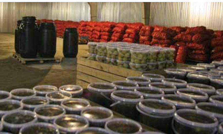
Заказы на соленья растут