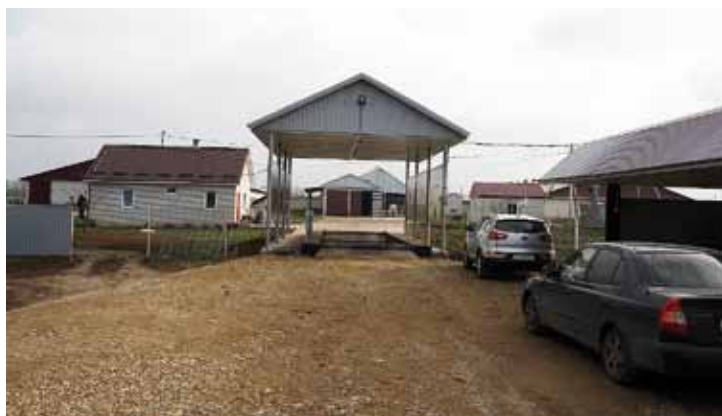
Путь на ферму – через санпропускник