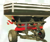
МВУ-2500 Грузоподъемность 2500 кг.