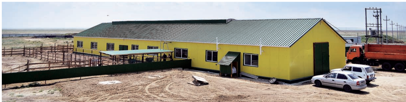
А так — снаружи