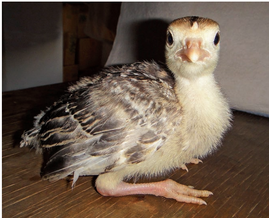
С рождения индюшат нужно следить за их здоровьем

Индюшата подвержены заболеванию гистомонозом. При этой болезни они поносят, худеют. Если она запущена, то чернеет голова птицы (отсюда ещё одно название болезни – «чёрная голова»). Поэтому начиная с двадцатого по двадцать пятый день каждому индюшонку надо давать по 1/4 таблетки «Метронидазола». С сорока пятого по пятидесятый день – по 1/2, а с семьдесят первого по семьдесят пятый – по целой таблетке, и так включительно до 150-го дня через каждые 20 дней.