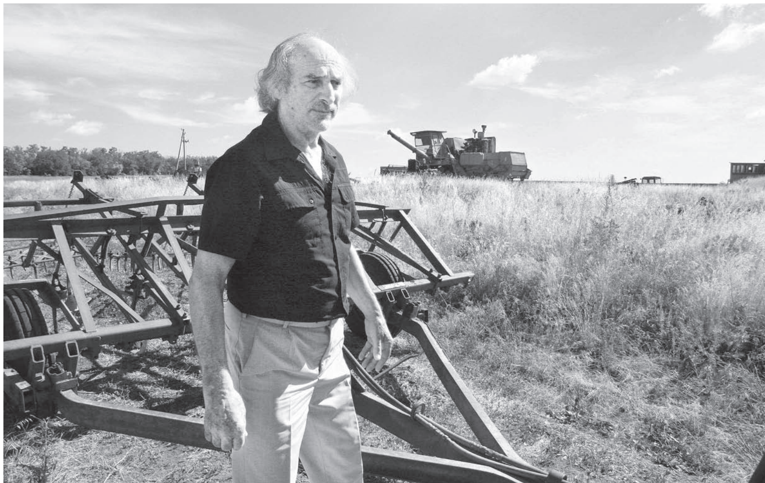
Что ни говори, а в одних руках техника служит дольше