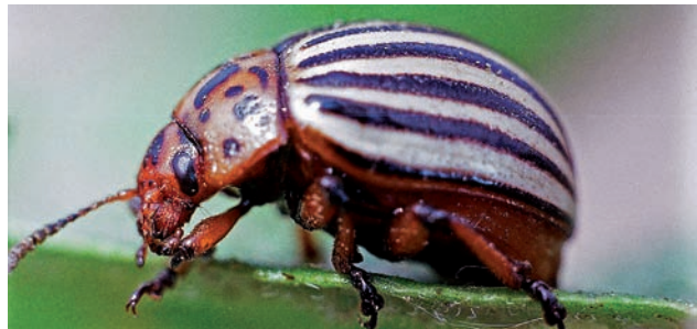
Бороться с колорадским жуком непросто

1. Колорадский жук боится чеснока. Поэтому под каждую картофелину при посадке нужно положить по щепотке шелухи. Также хороший способ – воткнуть зубки ярого чеснока между кустами картофеля. Ну а самым терпеливым советуем приготовить раствор: 200 г головок измельчить и настаивать сутки в 10 л воды. Перед опрыскиванием можно добавить в раствор 40 г хозяйствен-