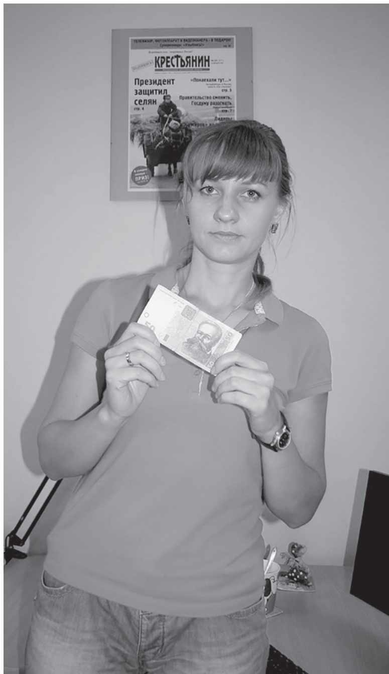
Чтобы обменять гривны на рубли, пришлось хорошо побегать