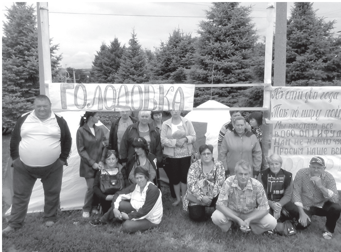
Из 300 обманутых «Оптифудом» работников на акцию вышли почти два десятка человек