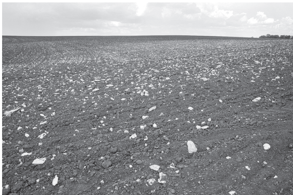
«Осталась мелочь, — говорит фермер, — крупные камни я вывез»