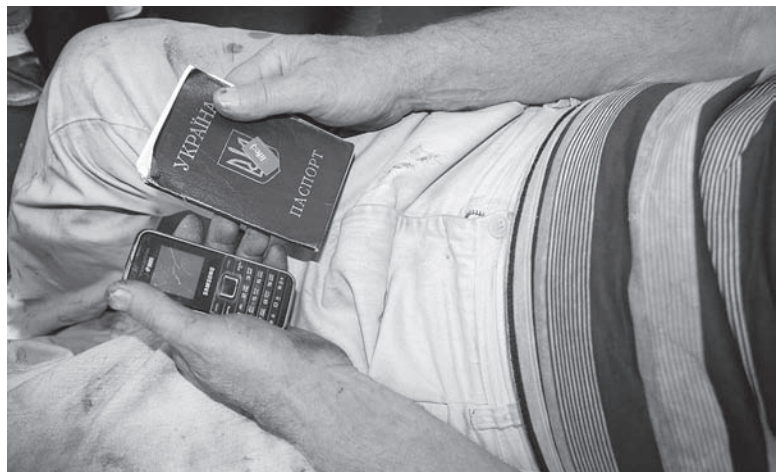
Телефон и паспорт – вот, в общем-то, и всё, что теперь связывает с родиной