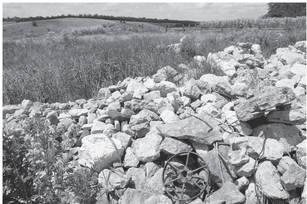
Остатки хутора Шахова...